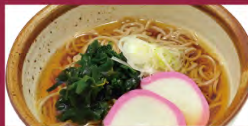
かけそば・うどん ビジター価格 ¥800(税込) メンバー価格 ¥660(税込)