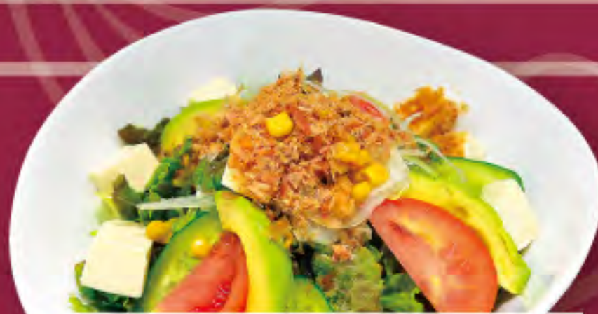
豆腐とアボカドのサラダ ビジター価格 | メンバー価格 ¥940(税込) | ¥780(税込)