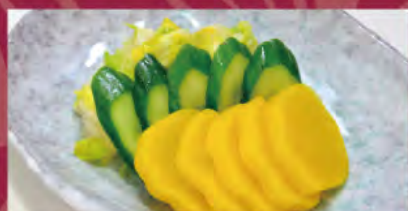
漬物の盛合わせ ビジター価格 ¥380 (税込) メンバー価格 ¥320 (税込)