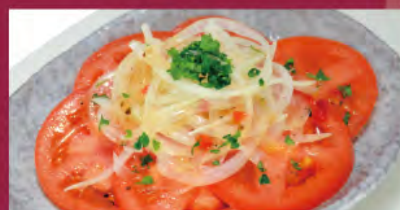
冷やしトマト ビジター価格 ¥500 (税込) メンバー価格 ¥420 (税込)