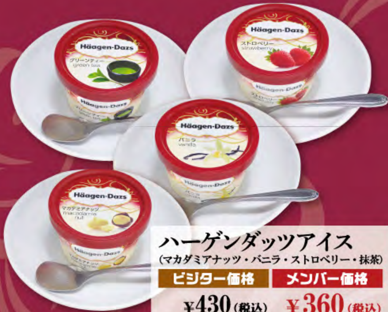
ハーゲンダッツアイス (マカダミアナッツ・バニラ・ストロベリー・抹茶) ビジター価格 ¥430 (税込) メンバー価格 ¥360 (税込)