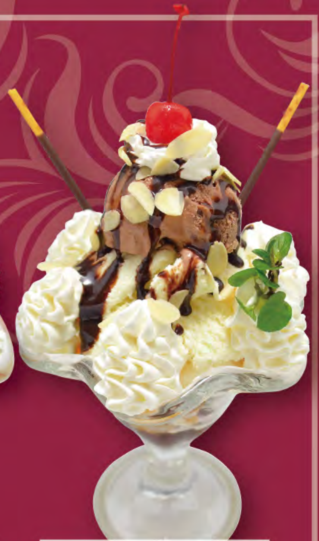
チョコレートパフェ ビジター価格 ¥820 (税込) メンバー価格 ¥680 (税込)