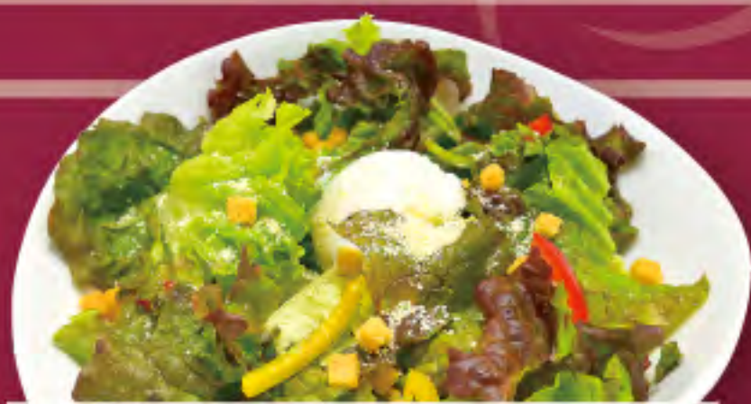
シーザーサラダ ビジター価格 | メンバー価格 ¥780(税込) | ¥650(税込)