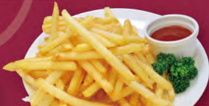
メガポテト ビジター価格 ¥700 (税込) メンバー価格 ¥580 (税込)