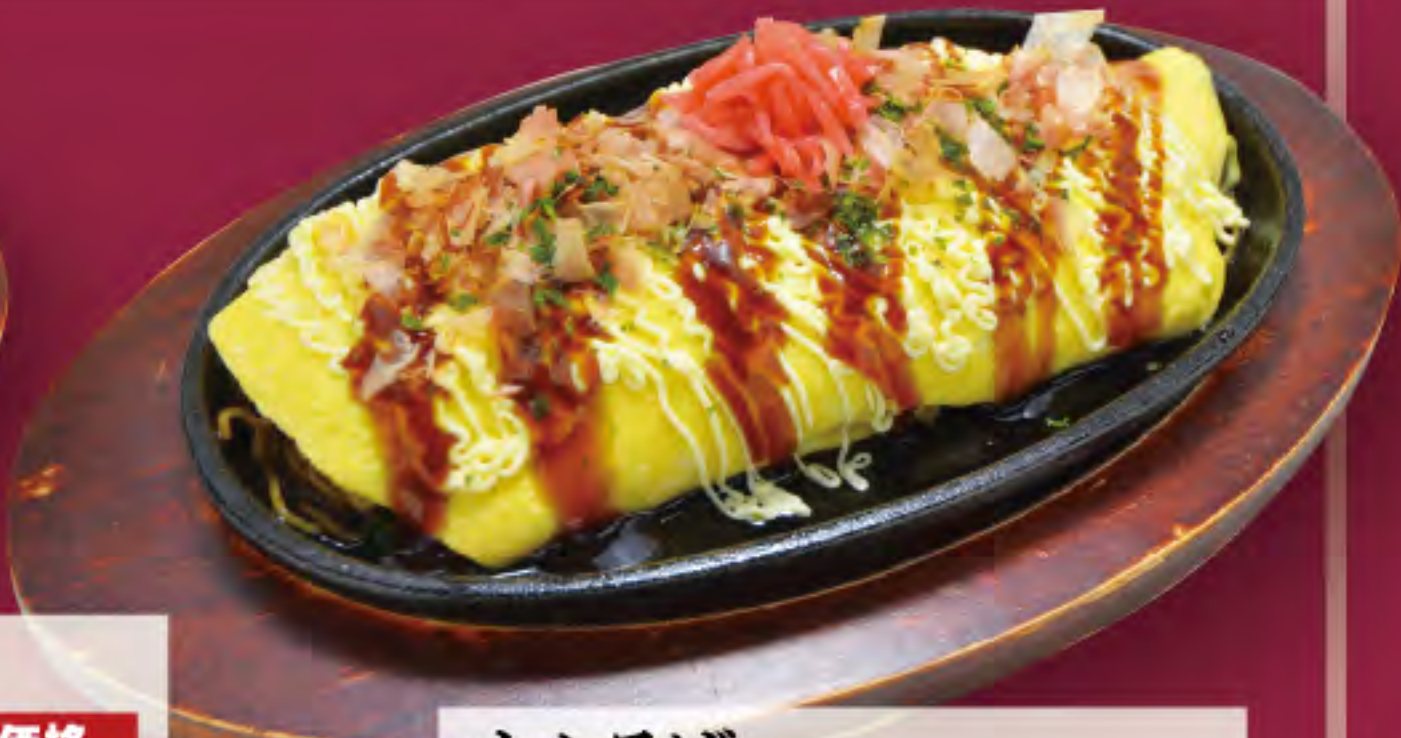
オムそば ビジター価格 ¥940(税込) メンバー価格 ¥780(税込)