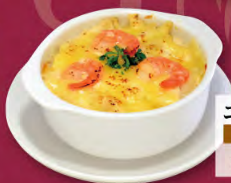
エビマカロニグラタン ビジター価格 | メンバー価格 ¥1,060(税込) | ¥880(税込)