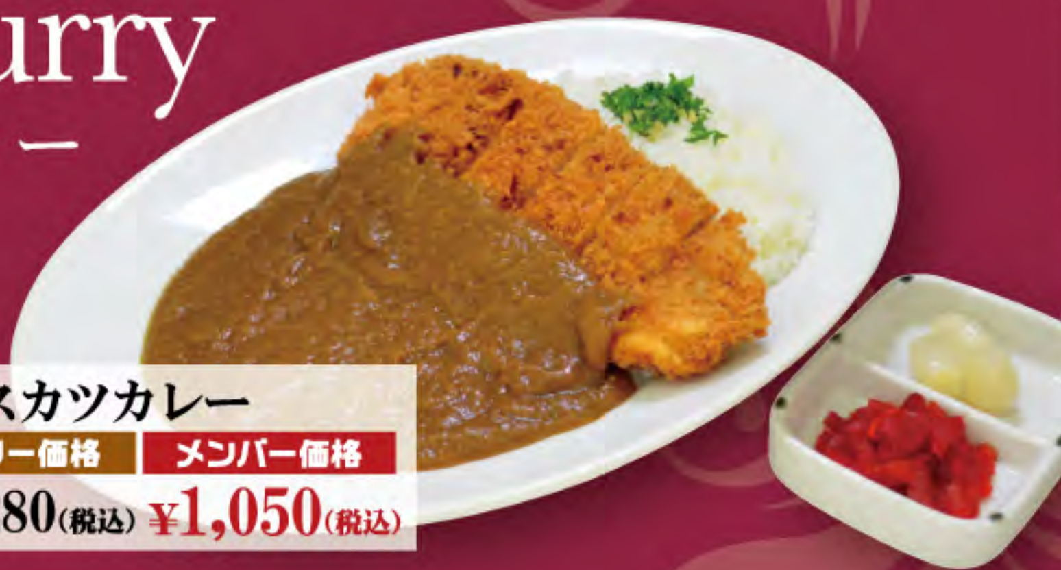
ロースカツカレー ビジター価格 | メンバー価格 ¥1,280(税込) | ¥1,050(税込)