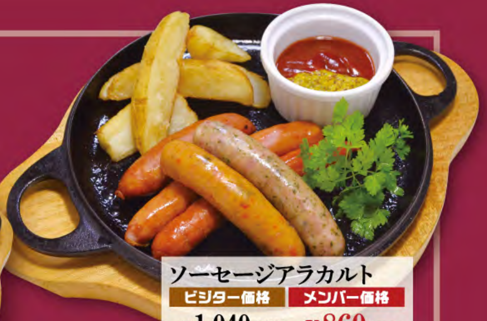
ソーセージアラカルト ビジター価格 ¥1,040 (税込) メンバー価格 ¥860 (税込)