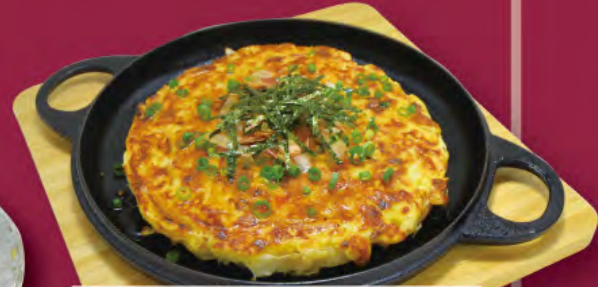
山芋の鉄板焼き ビジター価格 ¥820 (税込) メンバー価格 ¥680 (税込)