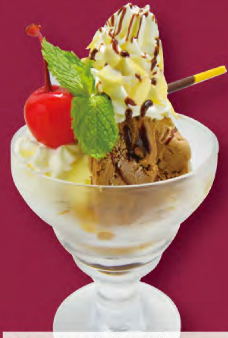
チョコっとサンデー ビジター価格 ¥390 (税込) メンバー価格 ¥310 (税込)