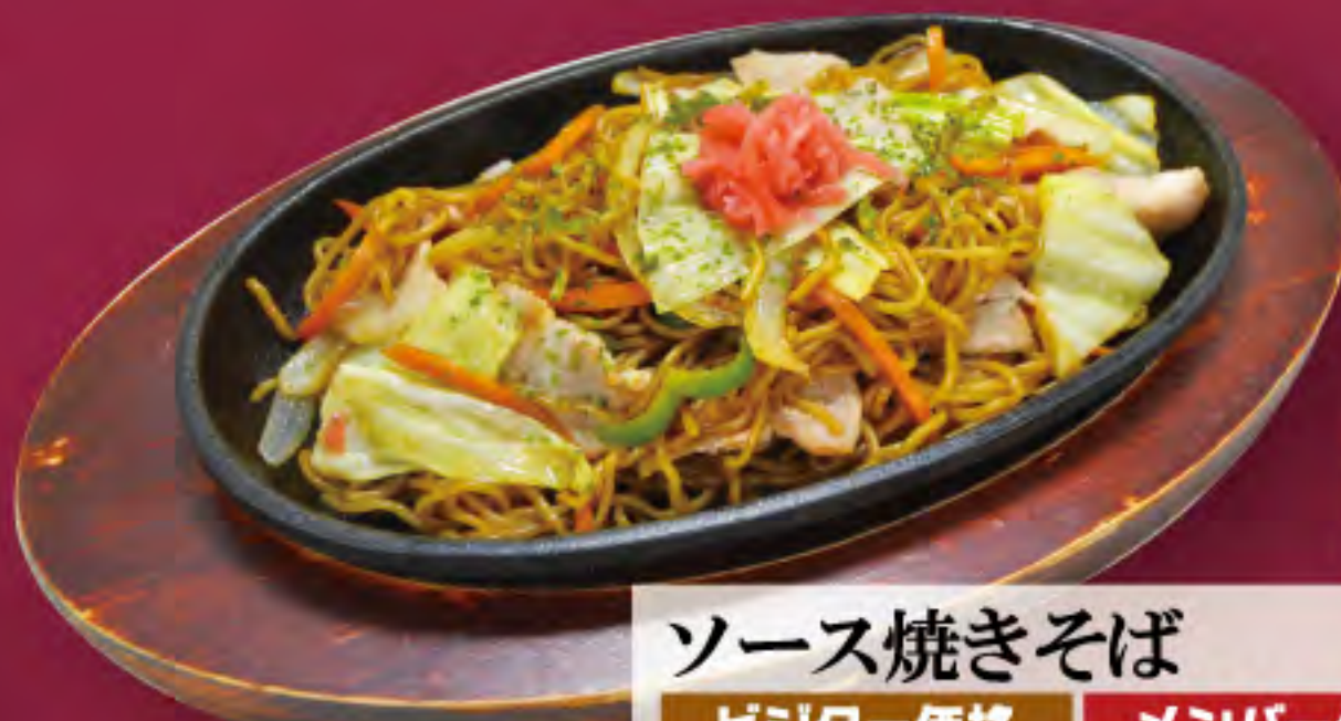
ソース焼きそば ビジター価格 ¥700(税込) メンバー価格 ¥580(税込)