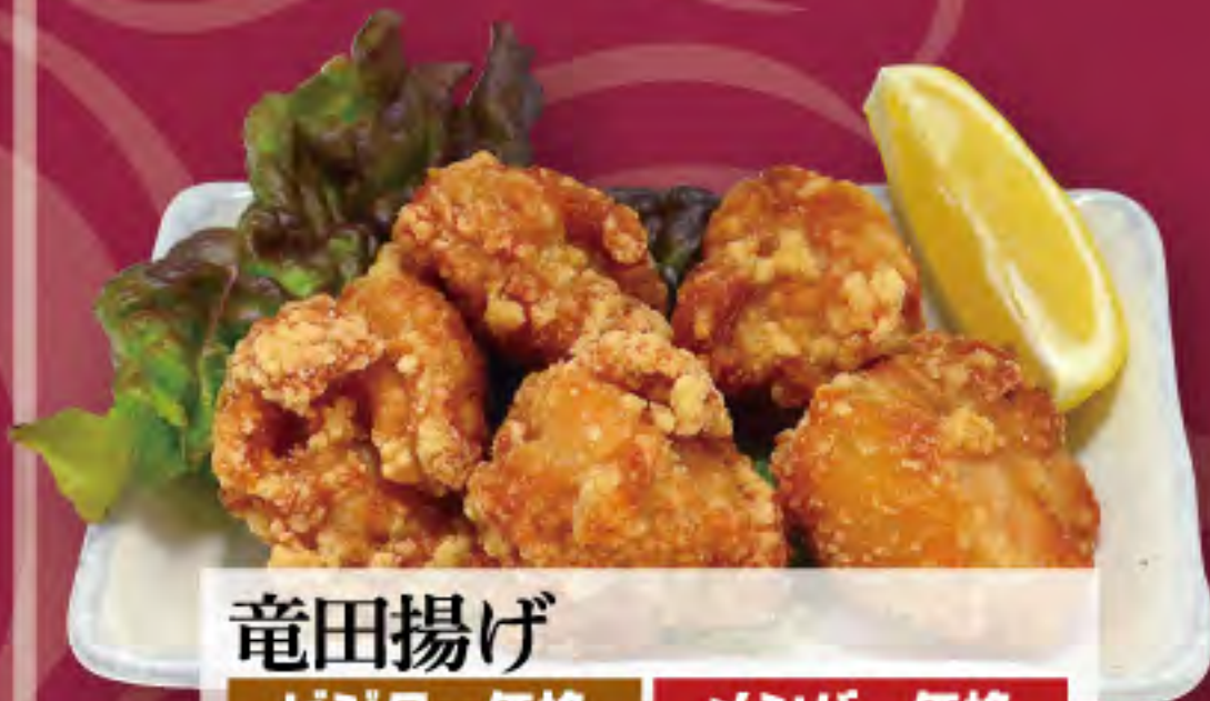
竜田揚げ ビジター価格 ¥700 (税込) メンバー価格 ¥580 (税込)