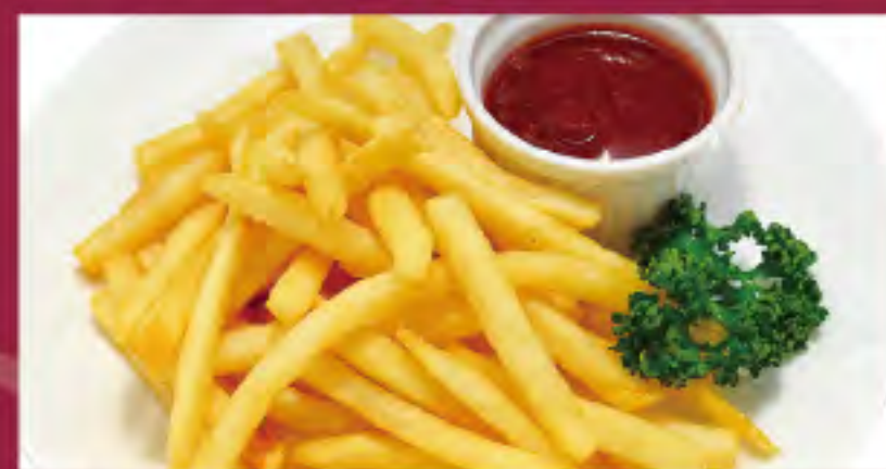
ポテトフライ ビジター価格 ¥460 (税込) メンバー価格 ¥380 (税込)