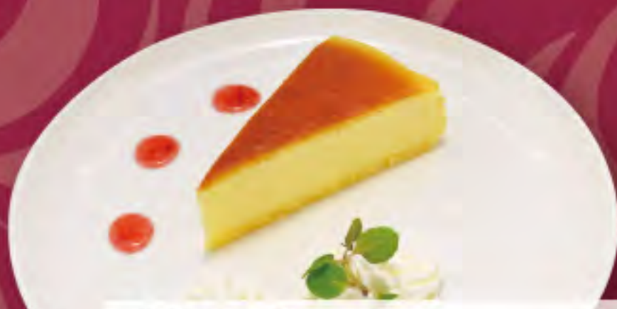
本日のケーキ ビジター価格 ¥700 (税込) メンバー価格 ¥580 (税込)