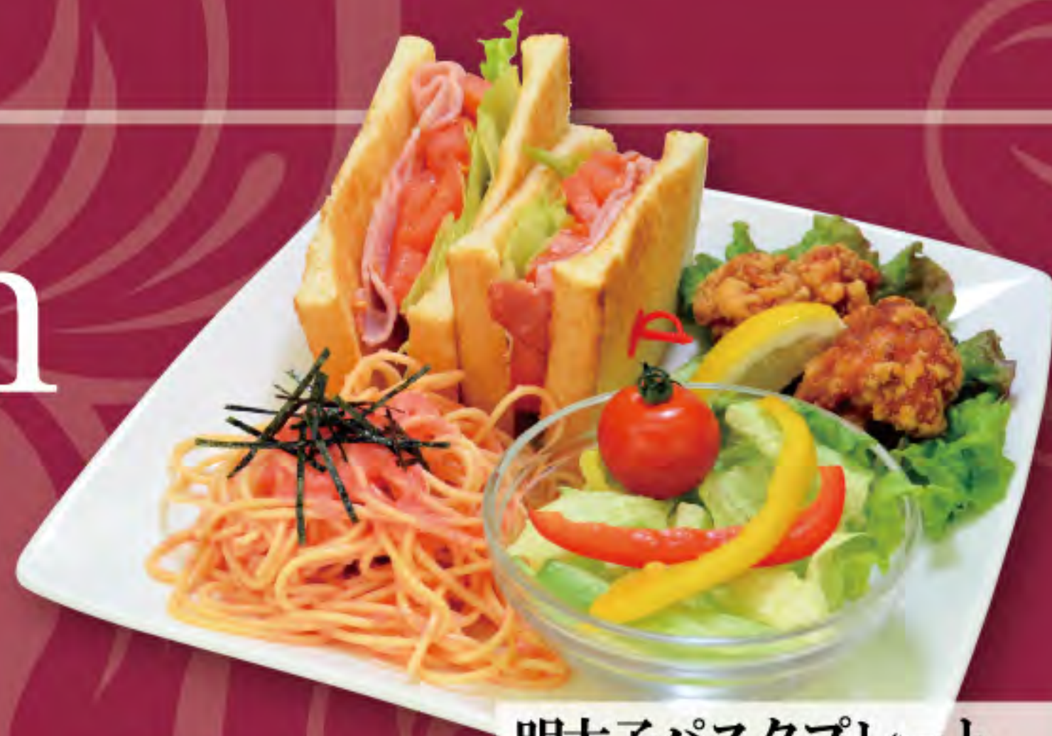
明太子パスタプレート ビジター価格 | メンバー価格 ¥1,190(税込) | ¥990(税込)