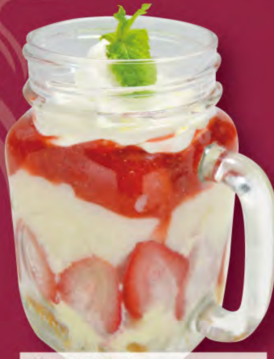
苺の杏仁パフェ ビジター価格 ¥820 (税込) メンバー価格 ¥680 (税込)