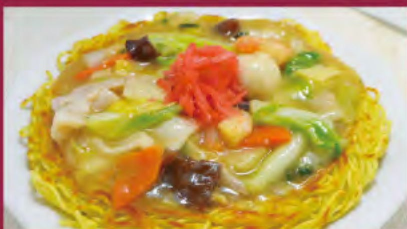
あんかけ焼きそば ビジター価格 ¥1,150(税込) メンバー価格 ¥920(税込)