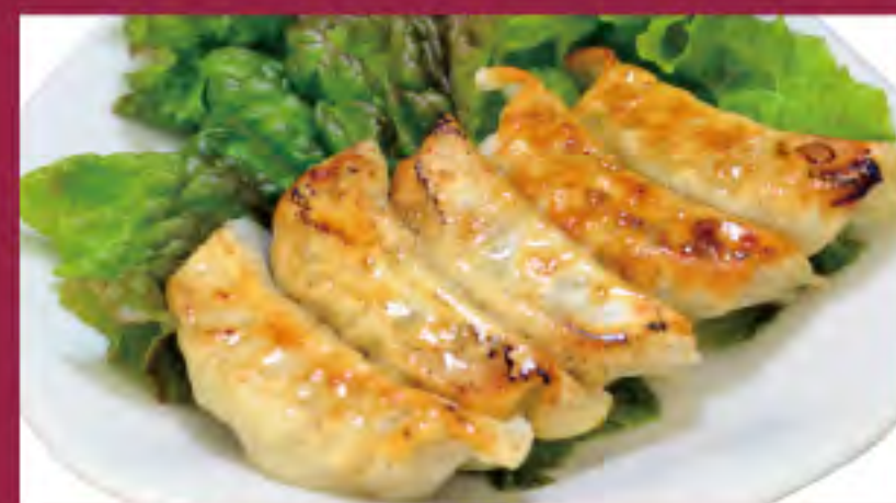
焼き餃子 ビジター価格 ¥640(税込) メンバー価格 ¥530(税込)