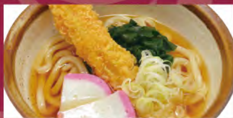
天ぷらそば・うどん ビジター価格 ¥1,040(税込) メンバー価格 ¥860(税込)