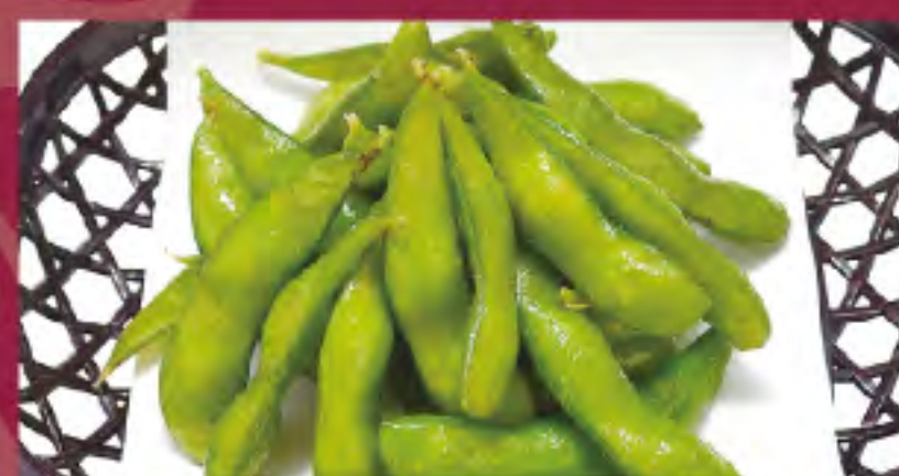
枝豆 ビジター価格 ¥380 (税込) メンバー価格 ¥320 (税込)