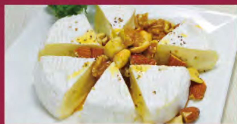
カマンベールナッツ ビジター価格 ¥1,060 (税込) メンバー価格 ¥880 (税込)