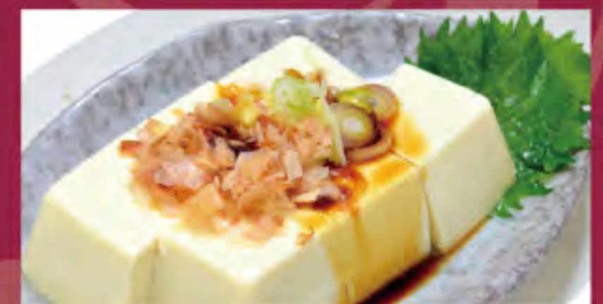
冷奴 ビジター価格 ¥460 (税込) メンバー価格 ¥380 (税込)