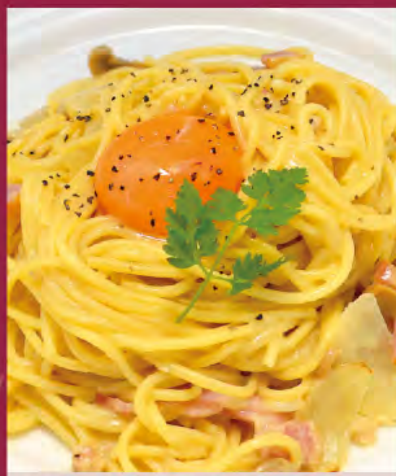
カルボナーラ ビジター価格 | メンバー価格 ¥1,130(税込) | ¥940(税込)