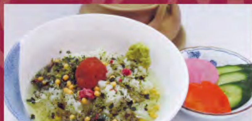
梅茶漬 ビジター価格 ¥580(税込) メンバー価格 ¥480(税込)