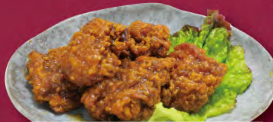
吉田の唐揚げ ビジター価格 ¥820 (税込) メンバー価格 ¥680 (税込)