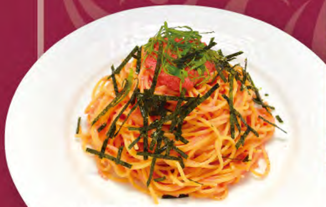
明太子パスタ ビジター価格 | メンバー価格 ¥1,030(税込) | ¥860(税込)