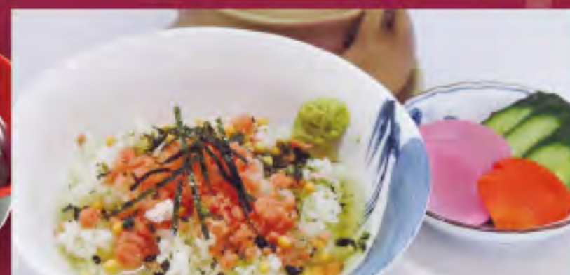
鮭茶漬 ビジター価格 ¥580(税込) メンバー価格 ¥480(税込)