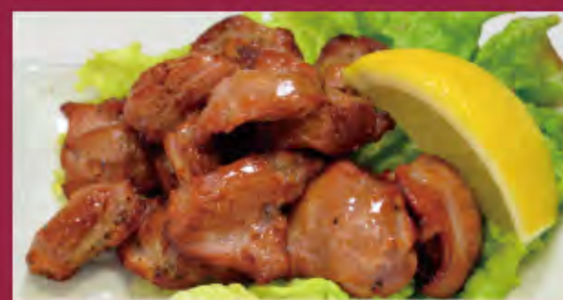
砂肝 ビジター価格 ¥580 (税込) メンバー価格 ¥480 (税込)