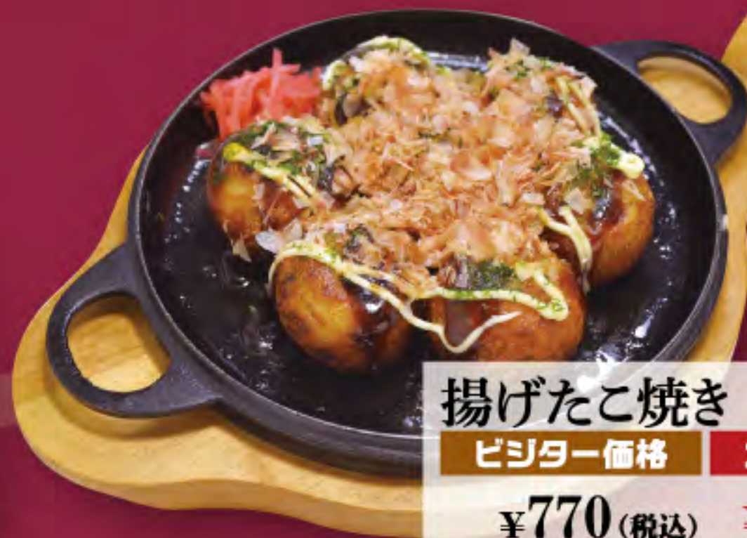
揚げたこ焼き ビジター価格 ¥770 (税込) メンバー価格 ¥640 (税込)