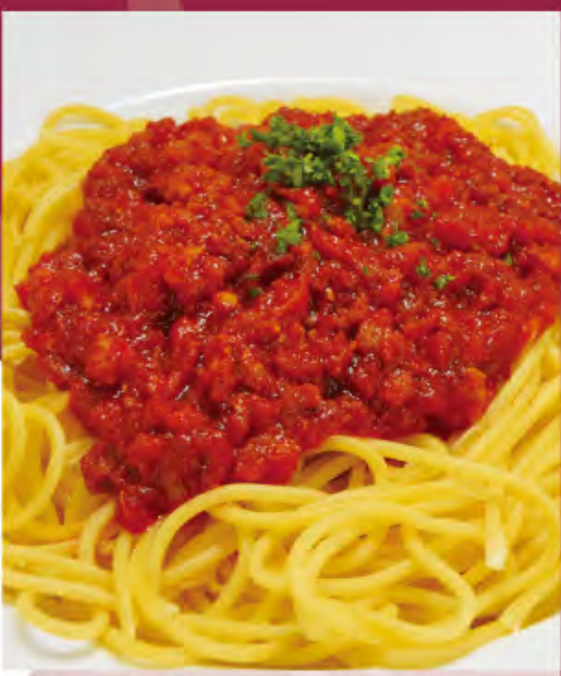
ミートソーススパゲティ ビジター価格 | メンバー価格 ¥1,130(税込) | ¥940(税込)