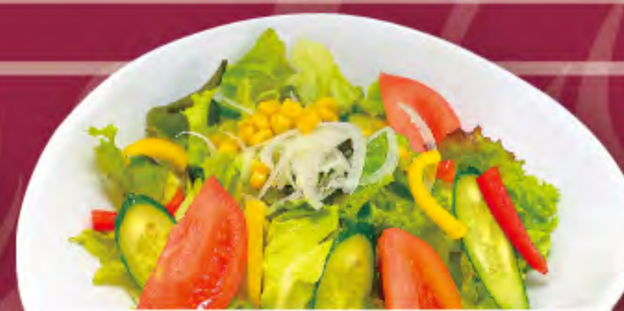
バラエティサラダ ビジター価格 | メンバー価格 ¥780(税込) | ¥650(税込)