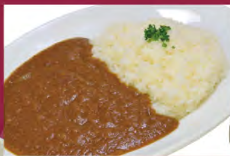
カレーライス ビジター価格 | メンバー価格 ¥860(税込) | ¥720(税込)