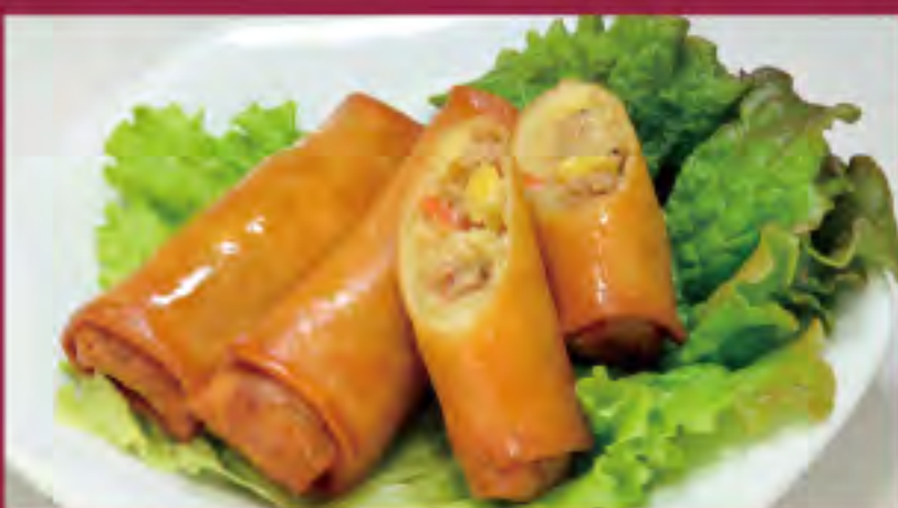
春巻き ビジター価格 ¥640(税込) メンバー価格 ¥530(税込)