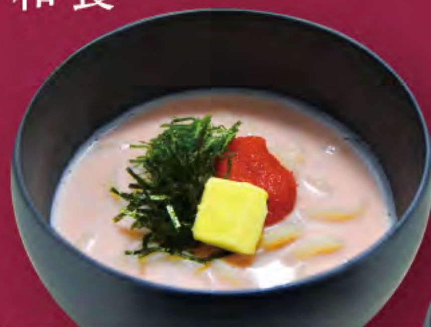
明太クリームうどん ビジター価格 ¥940(税込) メンバー価格 ¥780(税込)