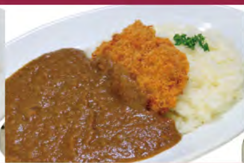
ヒレカツカレー ビジター価格 | メンバー価格 ¥1,280(税込) | ¥1,050(税込)