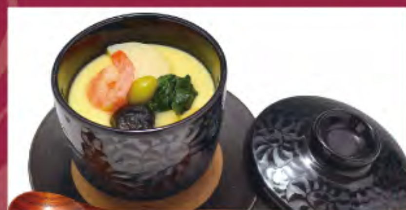
茶碗蒸し ビジター価格 ¥510 (税込) メンバー価格 ¥420 (税込)