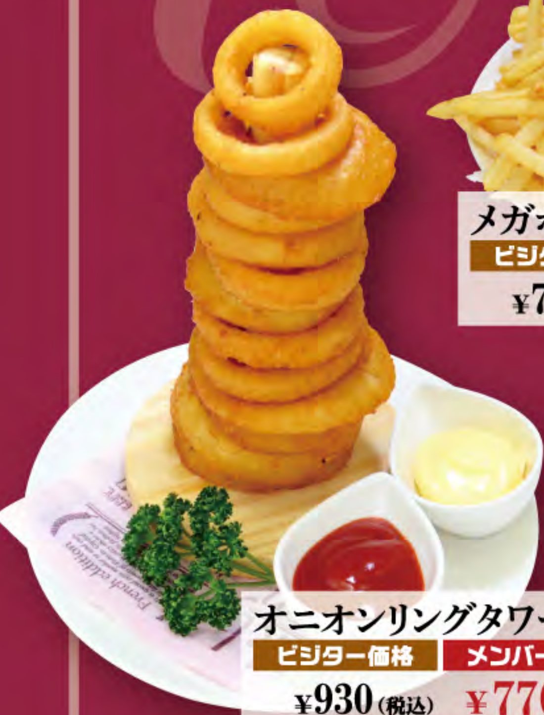
オニオンリングタワー ビジター価格 ¥930 (税込) メンバー価格 ¥770 (税込)