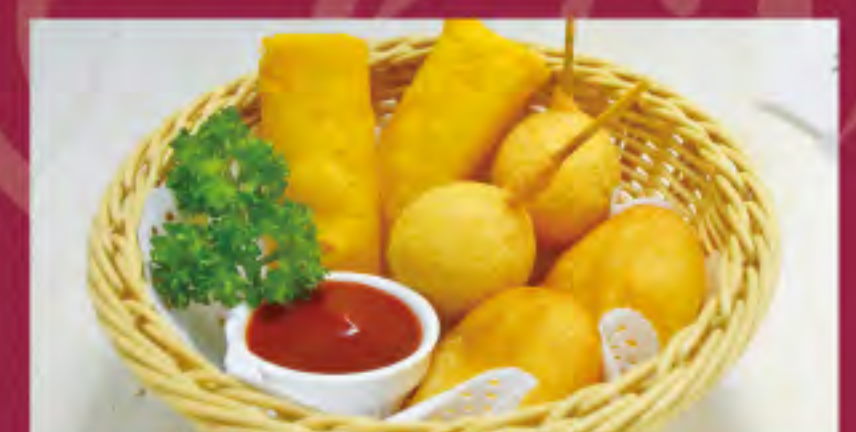
チーズフライ ビジター価格 ¥1,040 (税込) メンバー価格 ¥860 (税込)