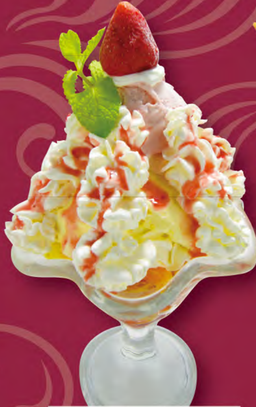
ストロベリーパフェ ビジター価格 ¥820 (税込) メンバー価格 ¥680 (税込)