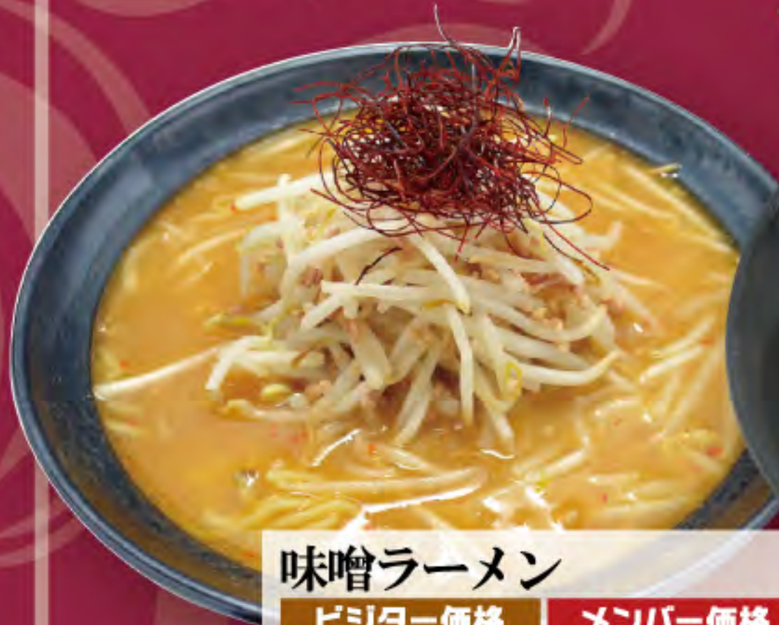
味増ラーメン ビジター価格 ¥1,040(税込) メンバー価格 ¥860(税込)