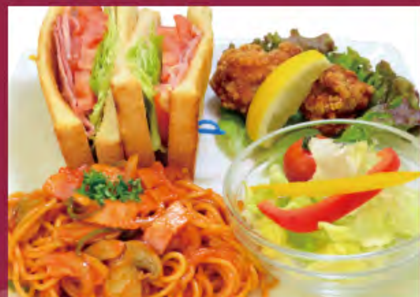
ナポリタンプレート ビジター価格 | メンバー価格 ¥1,190(税込) | ¥990(税込)