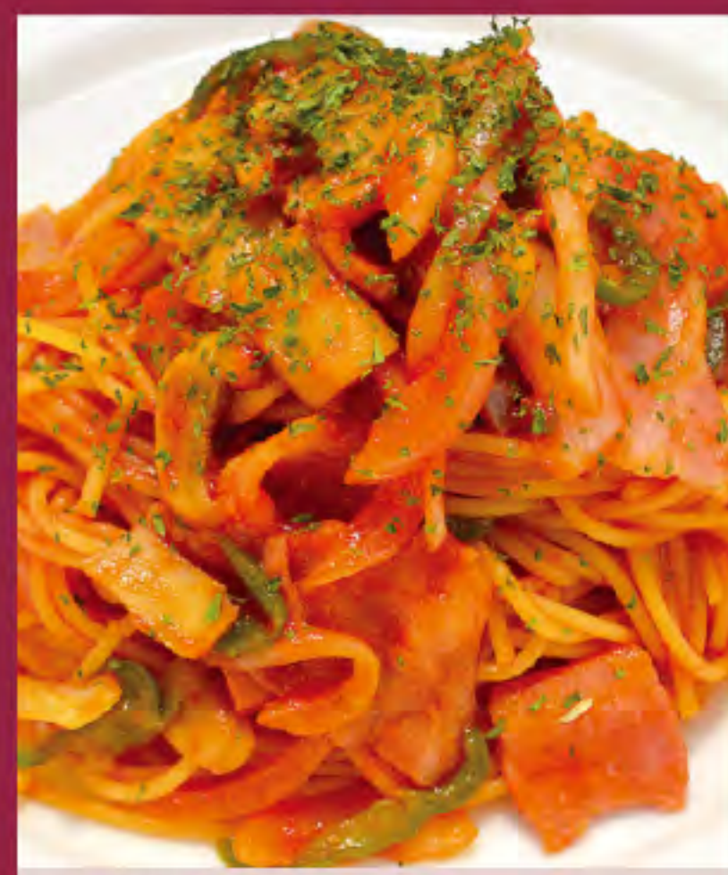
ナポリタン ビジター価格 | メンバー価格 ¥1,030(税込) | ¥860(税込)