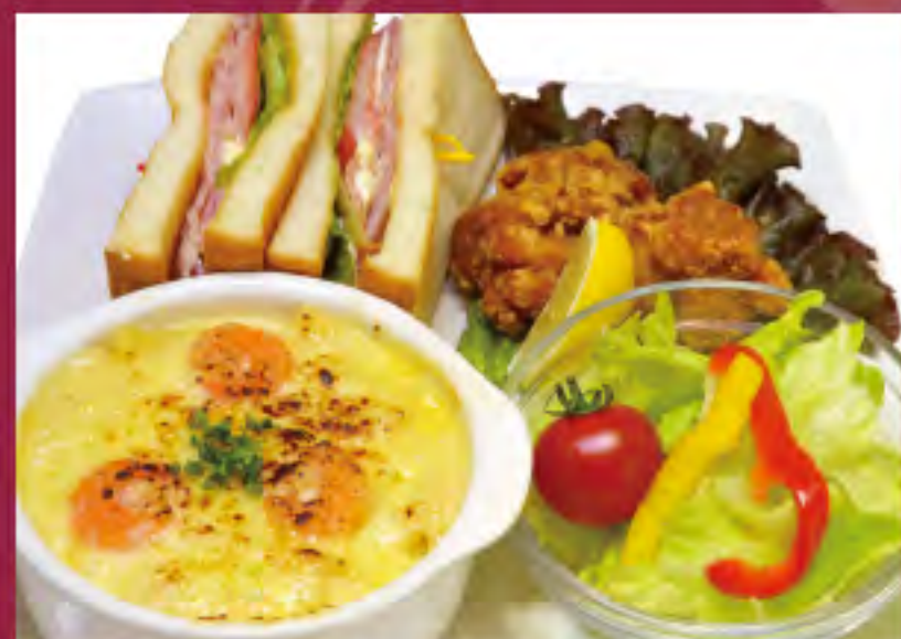
海老グラタンプレート ビジター価格 | メンバー価格 ¥1,530(税込) | ¥1,260(税込)