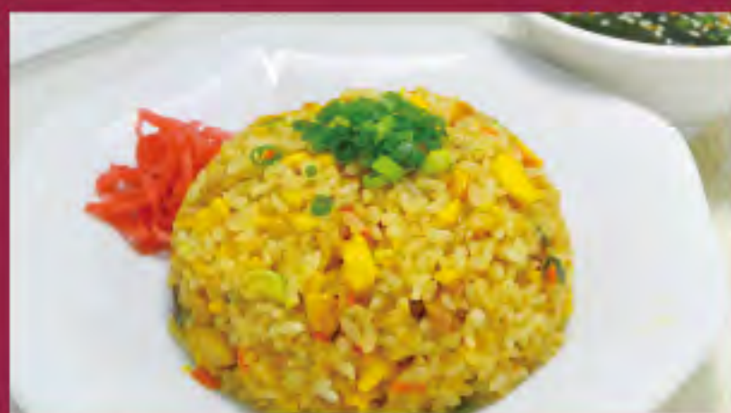
チャーハン ビジター価格 ¥820(税込) メンバー価格 ¥680(税込)