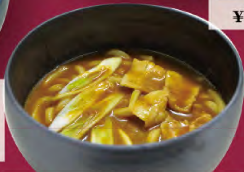
カレーうどん・そば ビジター価格 ¥940(税込) メンバー価格 ¥780(税込)