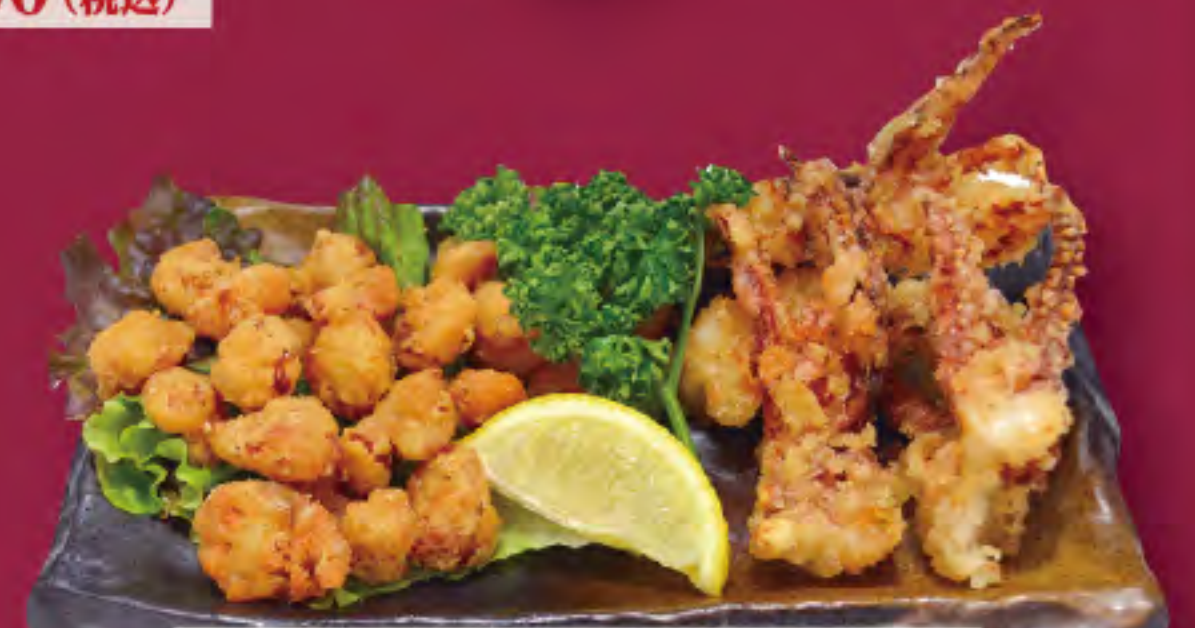
軟骨とイカ唐揚げ ビジター価格 ¥820 (税込) メンバー価格 ¥680 (税込)